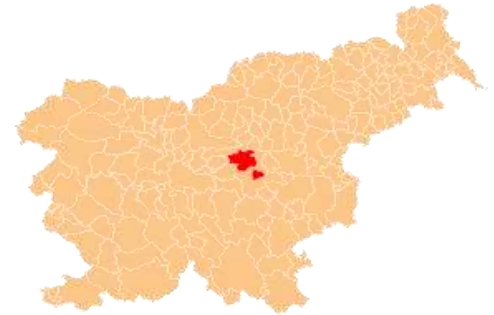
Slika 3: Zagorje ob Savi, zemljevid

Je razpotegnjeno mesto naselje in občinsko središče v rečice Medije od Podkraja do njenega izliva v Savo.