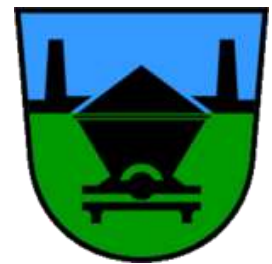
Slika 2: Trbovlje, grb

Gre za širše dolinsko območje potoka Trboveljščice z dvignjenim svetom ob robovih. So občinsko središče in imajo hkrati največ ustanov in funkcij središča regije, ki je sicer izrazito policentrična.