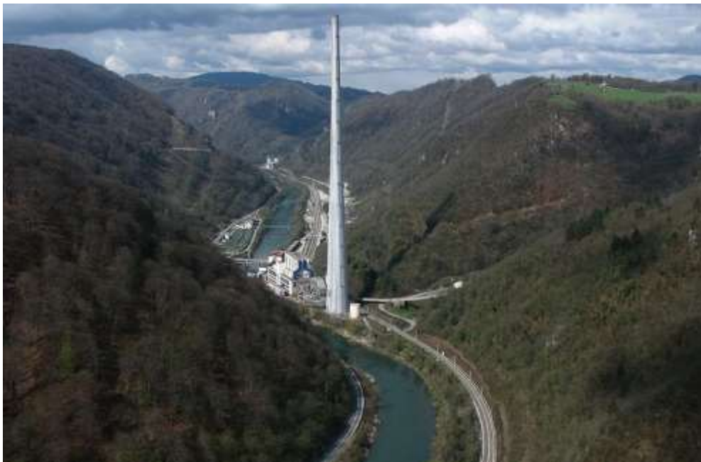
Slika 5: Trboveljski dimnik

Zadnji dan, bi po odličnem zajtrku in toplemu čaju pospravili vse stvari, ter jih vzeli s seboj in se pred odhodom v Zagorje ob Savi ustavili še pri najvišjem dimniku v Evropi.