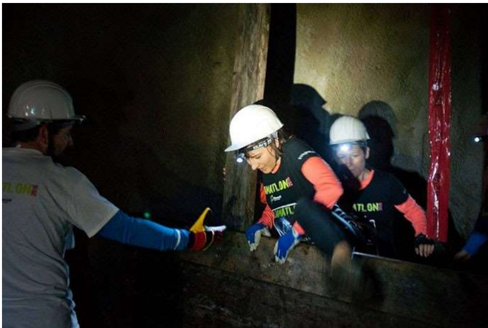
Slika 4: Jamatlon

Mladi, stari med 14 in 16 let lahko sodelujejo na Jamatlonu le s pisnim soglasjem staršev ali skrbnikov. Štartna pozicija je na Ajnzerju v Trbovljah rudar, kjer spremljevalec pregleda opremo udeležencev. Jamatlon je izjemno zanimiva izkušnja, posebej za mlade, ki so fizično dobro pripravljene. Trasa je speljana po talnem rovi, kjer udeleženci tudi premagujejo različne ovire, na primer jamski voziček. Mladi ob raziskovanju rogov vidijo tudi, kje in kako so se prevažali stari knapi. (Jamatlon, 2016)